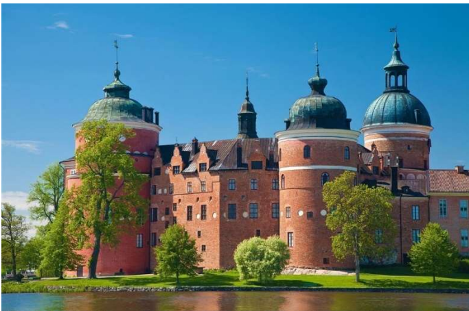
Mariefred, Schloss Gripsholm