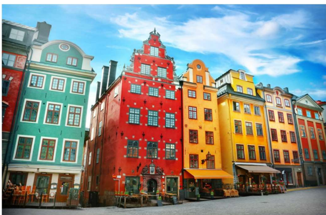
Gamla Stan, Altstadt Stockholm