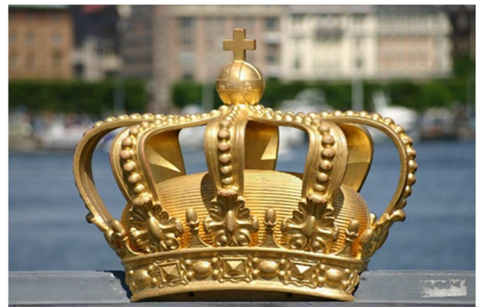
Schwedische königliche goldene Krone